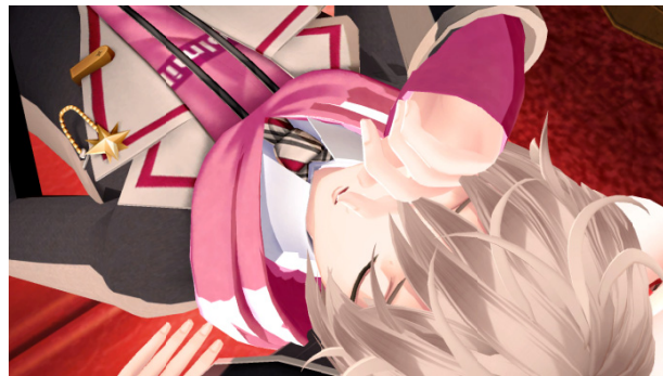
▲VR コンテンツ イメージ画像

本企画は、5 月 26 日（金）を皮切りに、平日毎日 7 日間連続でコラボレーションやキャンペーン情報などをお届けする「イケメン戦国◆時をかける恋 スペシャル 7days」の第 2 弾目の内容となります。